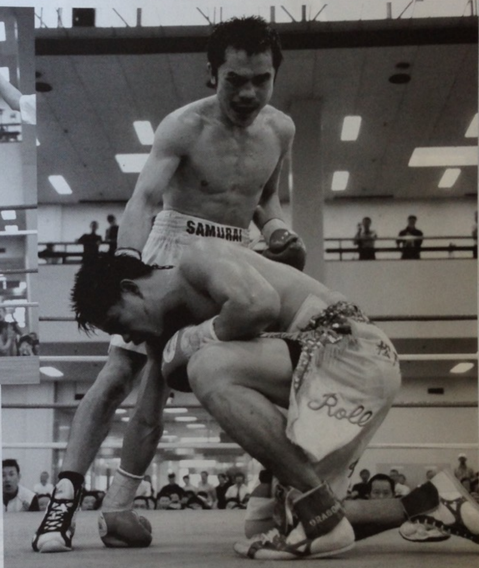
↑7回、大橋の起死回生の左ボディブローが決まると王者ロリーは片ヒザを着いてギブアップした ↑初挑戦で王座獲得した大橋は、左腕を掲げられると号泣